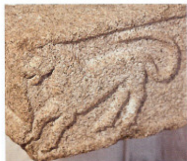
Detalje af billedkvader, nu udstillet i skibets nordøstre hjørne. Kvaderen kan have haft sin oprindelige plads i den nu nedbrudte romanske korbue.

Overgangen mellem skib og tårnrum dannes ved en bred, spidsbuet arkade brudt gennem skibets vestgavl. To billedkvadre er placeret som hjørnesokkel i hver side mod tårnrummet. Motiverne er pga. bænke og kalkrester vanskelige at tyde, men hjørnerne er udført som tovsnoning, mens siderne mod vest formentlig er udsmykket med slyngornamenter. Tårnrummet, der mod vest er udstyret med rundbuet, dobbeltfalset vindue, har muligvis været overhælvvet. I 1889 kunne de senere tilmurede for-tandinger endnu observeres.