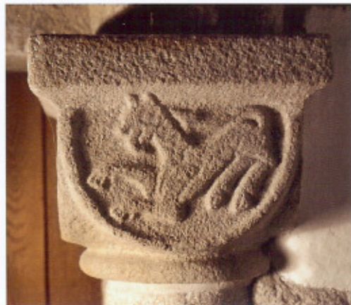
Detaljer af sydportal. Det lønner sig at kigge nærmere på kapitalernes sydvendte skjolde. Specielt den vingede grif på det vestlige kapital er veludført.