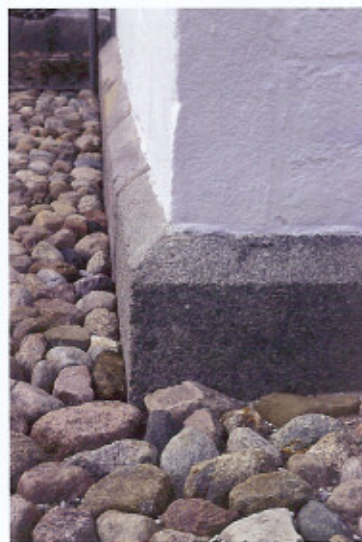
En skråkantsokkel som denne ses på mange af de jyske kvaderstenskirker.

for gods, der udelt skulle arves af den ældste søn. 27. marts 1799 blev kirken ved en auktion solgt til sognets tiendeydere, efter at stamhuset tre år tidligere var blevet ophævet.