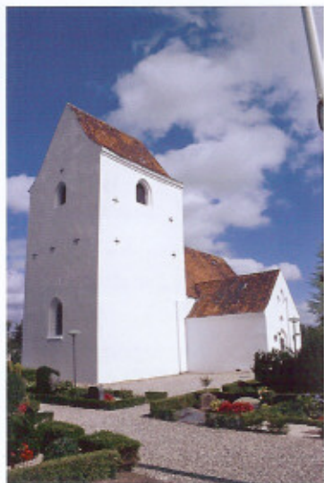
Kirken set fra sydvest. Hvidtekalken skjuler i dag tårnets cementoverpudsning fra 1800-tallet.