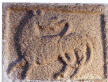
Umiddelbart til højre for nordportalens ses en billedkvader med løve. Hvorvidt placeringen er tilfældig, kan der kun gisnes om.