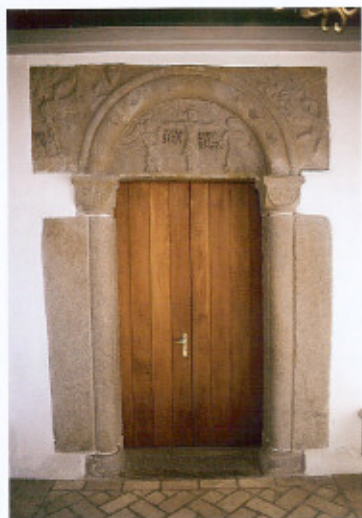
Kirkens imponerende sydportal, der i dag befinder sig inde i våbenhuset. De tre massive granitelementer stammer muligvis fra samme blok.