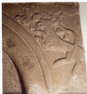
Detalje af relief fra sydportalen. En stridsmand ses i kamp med et løvelignende væsen. Over kampscenen sidder en rovfugl.

den berømte Kathoveddør på Ribe Domkirke og over kordøren i Gosmer Kirke syd for Odder.