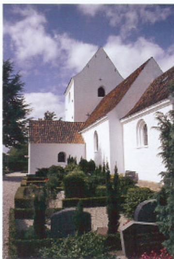
Fra sydøst ses alle kirkens bygningsdele. Vinduerne, der ses i kor og skib var oprindeligt lavere og smallere.

Det centrale motiv i det forsænkede tympanonfelt er en Korsfæstelsesscene. Kristus hænger iført lændeklæde på et indristet kors. På hver side af Kristus står en person, der identificeres ved latinske indskrifter. Til højre for Kristus lyder teksten: "NICHAEIAM/GEIVS" (Michael angelus), til venstre for Kristus: "SCA/NCT/VSIQH/ANMES" (sanctus Johannes). Ærkeenglen Mikael er usædvanlig som