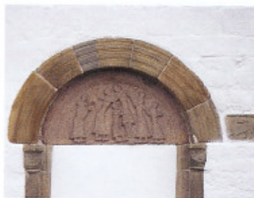
Det profilerede bueslag giver nordportalens tympanon en værdig indramning. Selve døråbningen blev tilmuret i senmiddelalderen.

Foruden Kristus ses fem figurer, de to yderste er de eneste, der ikke støtter det afsjælede legeme. I udførelsen af relieffet er der slående ligheder med sydportalens Korsfæstelsesscene, idet den lange Kristus også her har et kort lændeklæde, stiv postur og samlede fødder. De øvrige personer vender ansigtet mod beskueren, mens fodstillingen peger mod hovedpersonen, som på sydsiden. Der findes kun tre eksempler på Korsnedtagelsen hugget i granit i Danmark. Foruden i Tranbjerg ses motivet på