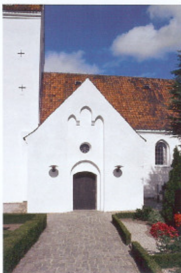
Våbenhusets gavl med tredelt blændingsdekoration over døren.