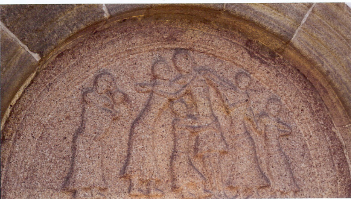
Kirkens to tympanonsten. Øverst Korsfæstelsesscenen fra sydportalen med den udmalede indskrift. Nederst Korsnedtagelsen fra nordportalen. Portalernes granitrelieffer er bemærkelsesværdige i både udførelse og motivvalg, og de er glimrende eksempler på de jyske stenmestres formåen i perioden omkring år 1200, hvor kirker af sten rejstes overalt.